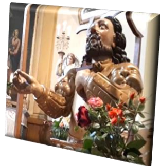
Église de Bax (31)

Tribun des armées romaines à Vienne. Il a été arrêté et torturé pour avoir accueilli St Germain de Brioude et pour son refus de persécuter les chrétiens. Lorsqu'il était en prison, il s'est évadé, a traversé le Rhône à la nage et a été repris sur les berges du Gier. Il a été décapité vers 304.