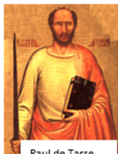
Paul de Tarse

Created by Puzzlemaker at DiscoveryEducation.com