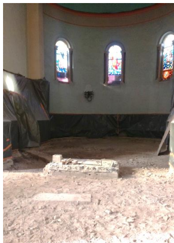
Une vue au début des travaux

Pour mémoire l'église Notre Dame actuelle a été construite à l'emplacement d'une église du 12 ème siècle, dépendant du prieuré de l'abbaye de Saint-Chef, et détruite en 1859.