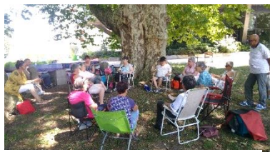
En juillet, au parc de Lilattes

Bonne occasion de voir du monde, de se changer les idées et de bavarder.