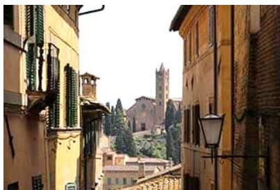
La vue de Sienne