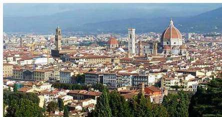
Vue de Florence

Départ pour Florence Visite des Chapelles Médicéennes/Messe à Santa Maria Novella/Visite de la Cathédrale Déjeuner sur place Visite de l'église Ste Croix/Montée au belvédère Michel-Ange et à l'église San Miniato Retour à Montecatini