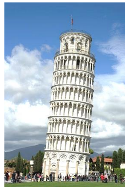
La Tour de Pise

Départ pour Pise Visite extérieure de la Tour et de quelques monuments alentours/Messe sur place Déjeuner sur place Arrivée à Bourgoin vers 21h/22h