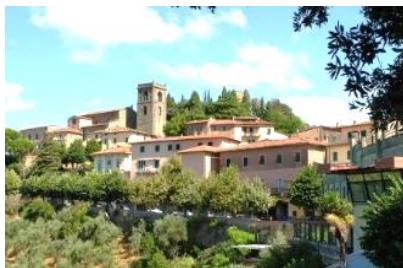
Vue de Montecatini

Départ de Bourgoin vers 7h Pique-nique en route Messe à Pavie près du tombeau de St Augustin Arrivée à Montecatini (lieu d'hébergement durant tout le séjour)