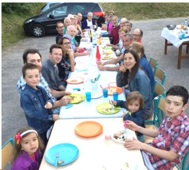
Repas convivial du Relais St Alban-Domarin-3 Vallons pour clôturer joyeusement l'année scolaire