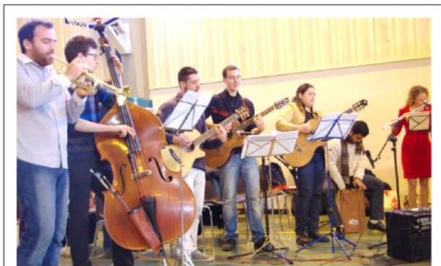
l'équipe de la messe des Jeunes anime la messe de rentrée