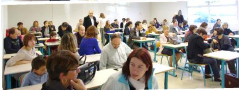
Temps Fort pour les enfants de catéchèse et leurs parents, 18h le matin