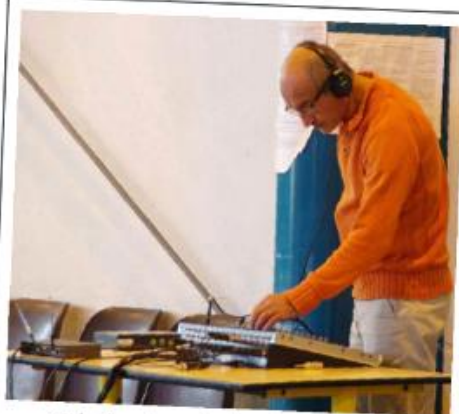
pendant ce temps, les derniers préparatifs ...