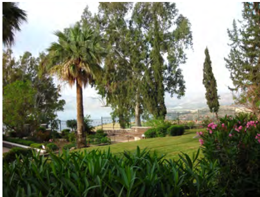
Vue du Mont des Béatitudes sur le lac de Tibériade

Frédéric Forno, jésuite, Prier, juin 2005