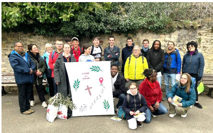
La marche des Rameaux