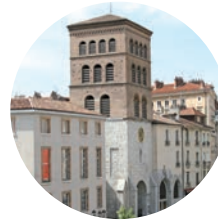
cathédrale Notre-Dame de Grenoble (place Notre-Dame) www.cathedraledegrenoble.com