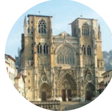
cathédrale Saint-Maurice de Vienne (place Saint-Paul) www.cathedraledevienne.fr