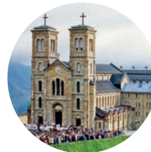
sanctuaire Notre-Dame de La Salette (La Salette-Fallavaux) www.lasalette.ccf.fr